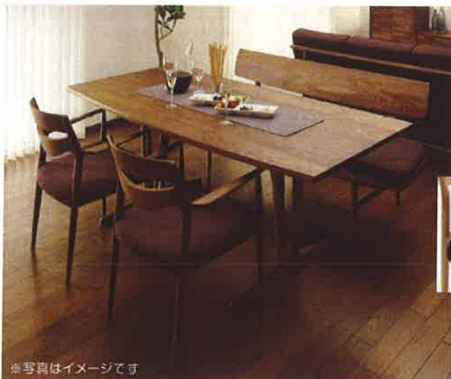
※写真はイメージです