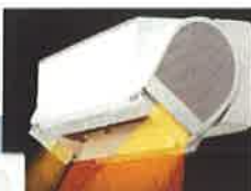
○ハイブリッド気流