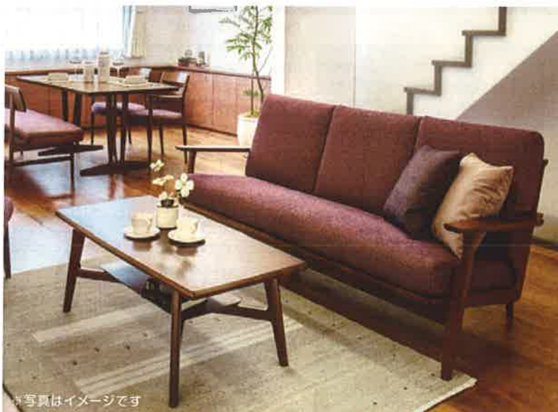
※写真はイメージです